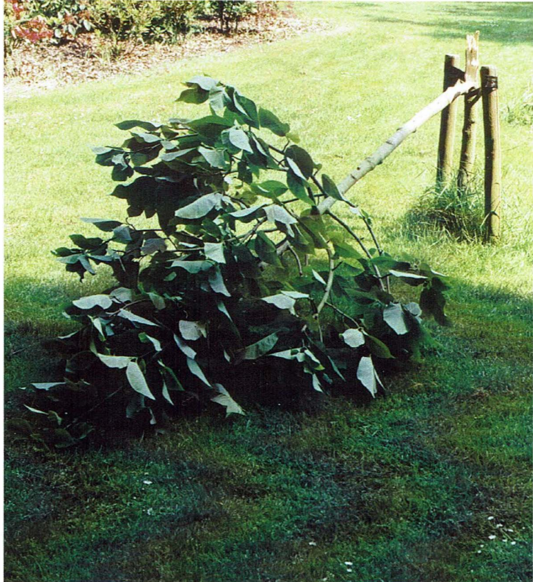
Een enkele jaren geleden voor veel geid aangeschafte Mangolia lag eind mei plotseling geknakt in het gazon vóór het Tennishuisje. In de buurt waren overal zwarte remsporen te zien van brommers of scooters waarmee onverantwoorde lieden hun circusacts hadden uitgevoerd.