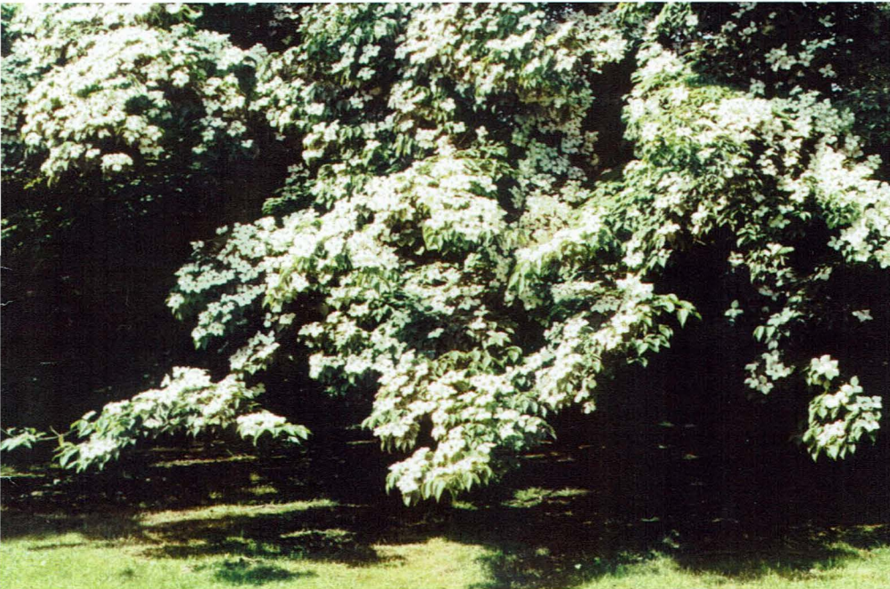
Dit jaar heeft de Japanse kornelje ( Cornus kousa ) weer uitbundig gebloeid. Op dit moment is de boom gefooid met ontelbare groene vruchten die langzamerhand zullen rijpen en in de vroege herfst fraai bloeiroot zullen worden.