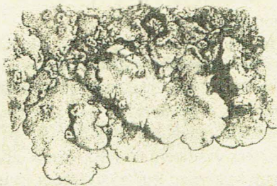
Gestippeld schildmos (Parmelia subrudecta) is een grijsgroene korstmos op bomen, dat aan de onderzijde typisch witte punten heeft. Komt in het Cantonspark voor op enkele boomstammen, waaronder die van de oudste beuk van het park, die op het eerste gazonetje rechts van de entreeaan staat. (Tekening - met toestemming - overgenomen uit artikel van Aptroot.)