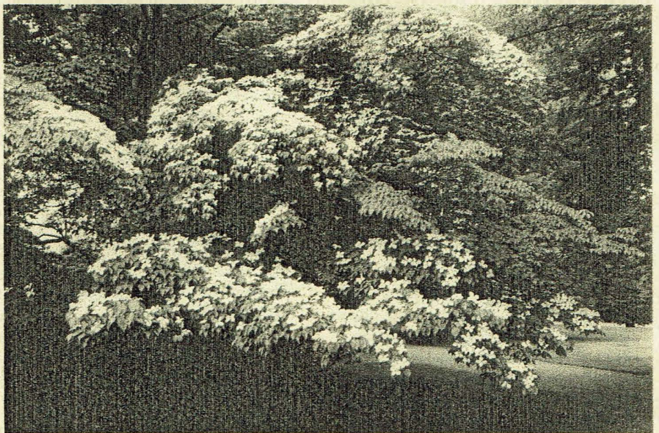
De Japanse kornoelje ( Cornus kousa , nr. 60), die aan de overzijde van het gazon tegenover het tennishuisje staat, is er één van de vele juwelen van het Cantonspark. Hij bloeit in juni en vormt daarna de karakteristieke vruchten die ook in het logo van de Vrienden van het Cantonspark zijn afgebeeld.

De Gids voor het Cantonspark, die in december 1995 was verschenen is om verschillende redenen aan een nieuwe druk toe. Een aantal bomen en struiken die erin behandeld werden zijn inmiddels verdwenen en een aantal nieuwelingen is er voor in de plaats gekomen. Wij hadden ons indertijd bij de keuze van op te nemen soorten vooral laten leiden door zeldzaamheid of het bijzondere karakter van bomen en een groot aantal "gewone" soorten buiten beschouwing gelaten. Ervaring, opgedaan tijdens rondleidingen,