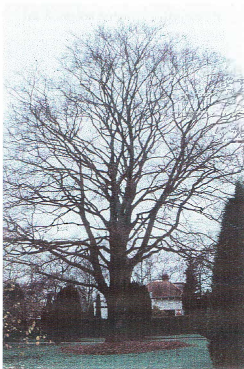
De oude beuk nabij de ingang van het Cantonspark, met zijn vrijwel bolronde kroon en bijzondere vertakkingswijze

zijn voor een groot deel "ontstaan" in de laatste decennia van de 19 de eeuw en hebben op veel plaatsen de gewone beuken verdrongen uit parken en tuinen. De bladeren, bloemen en vruchten zijn bruinachtig met purper erdoor en ze zijn tegenwoordig verkrijgbaar in een grote variatie aan kleuren en vormen. Een cultivar die bij volledige uitgroei een zuilvorm heeft is 'Dawyck'. Het is een vorm die ontstaan is in Schotland, in het landgoed Dawyck. Deze had aanvankelijk bladvorm en kleur, als bij de gewone beuk, maar door kruising zijn er vormen met afwijkende bladkleur ontstaan, zoals onze Fagus sylvatica 'Dalwyck Gold', waarvan enkele jonge exemplaren zijn geplant nabij de Kinderboerderij (132b).