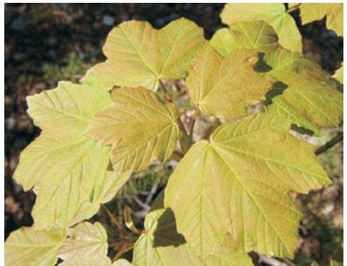
Jonge bladeren van de A. opalus Mill. Duidelijk zijn de afgeronde insnijdingen tussen de lobben te zien.

De soort komt oorspronkelijk uit Noord Afrika, maar is al in 1752 , via Frankrijk in onze streken geïntroduceerd. De bovengenoemde ondersoort is afkomstig van Balkan en Italië en zou dus logischerwijze beter de naam Italiaanse esdoorn kunnen dragen.