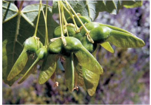
Foto's boven en midden: A. opalus Mill. Vanaf links naar rechts: bloei, bladknoppen, bloesem en vruchten.