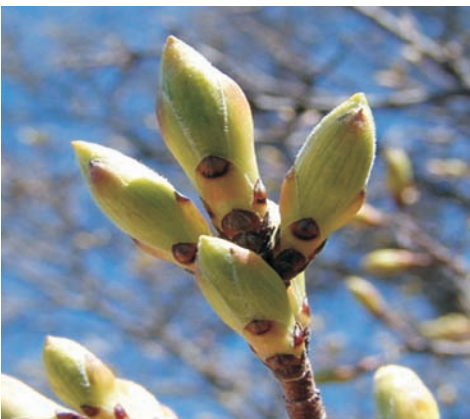
Foto's onder en pag. 13: A. monspesulanum L. Van links naar rechts: Bladknoppen, bloesem, blad en vruchten.