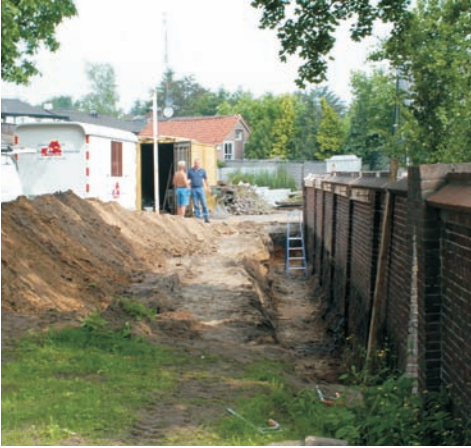
Foto boven: Om te voorkomen dat bij het rechtduwen de muur niet zou breken is er aan de buitenzijde een diepe gleuf gegraven voor minder weerstand.

Foto's rechts en rechts onder: Nadat de muur bij de kinderboerderij is rechtgeduwd worden de eerste voorbereidingsen getroffen voor het aanbrengen van de stempels aan het gedeelte van de muur in het Cantonspark.