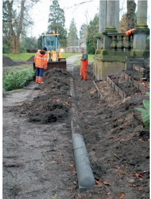
De colonnade tijdens de restauratie zijn.

De Bontbladige maagdenpalm, waarvan de wetenschappelijke naam Vinca major 'Variegata' is, heet in sommige plantenboeken ook wel 'Elegantissima'. Maar met laatstgenoemde naam is meteen al iets mis, want dat moet zijn: var. elegantissima G. Nicholson; deze auteur vond dat er sprake was van een variëteit en niet van een cultivar! Op het verschil tussen deze twee categorieën kan ik hier niet in gaan, maar het gaat om een fundamenteel verschil dat de doorsnee liefhebber overigens worst zal