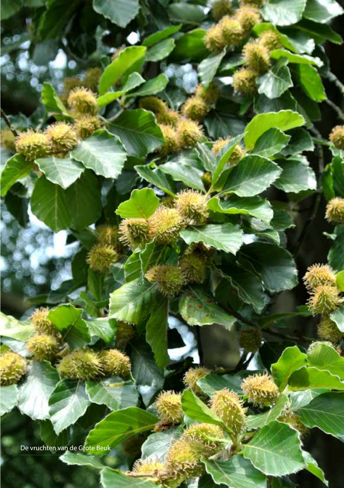
De vruchten van de Grote Beuk