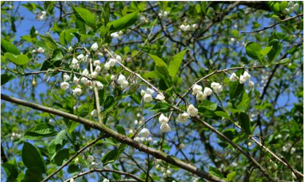
Halesia carolina (Sneeuwkllokjesboom)

Het bestuur van de Stichting Vrienden van het Cantonspark wenst u veel leesplezier, een fijne zomer en kom vooral genieten in het park.