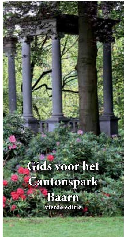
Gids voor het Cantonspark Baarn vierde editie

de personen in hun organisatie, die in de loop van de daarop volgende jaren een netwerk van externe deskundigen bij hun werkzaamheden hebben betrokken. Zowel deze gids, als publicaties in nieuwsbrief en op de website van de Vrienden van het Cantonspark voorzien in toenemende mate in een groeiende behoefte. Er zijn in de afgelopen jaren nogal wat bomen verloren gegaan door ziekten of zware stormen maar er zijn ook nieuwe bomen bijgekomen. Daarnaast zijn bomen vrij komen te staan, sterk uitgegroeid of