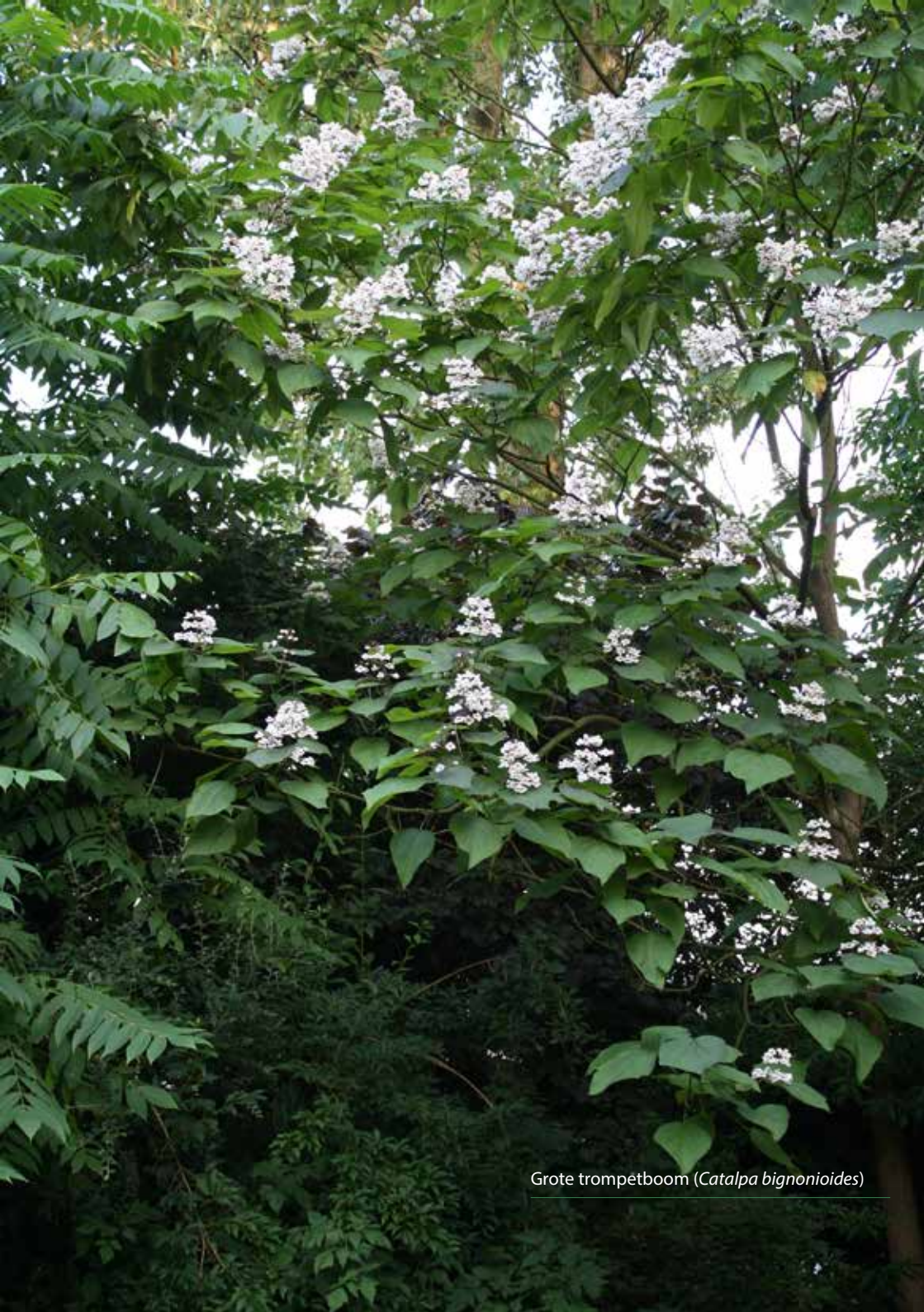
Grote trompetboom ( Catalpa bignonioides )