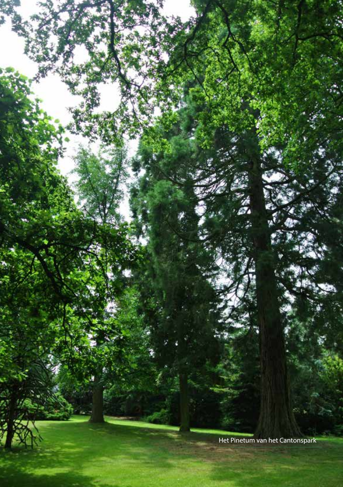
Het Pinetum van het Cantonspark