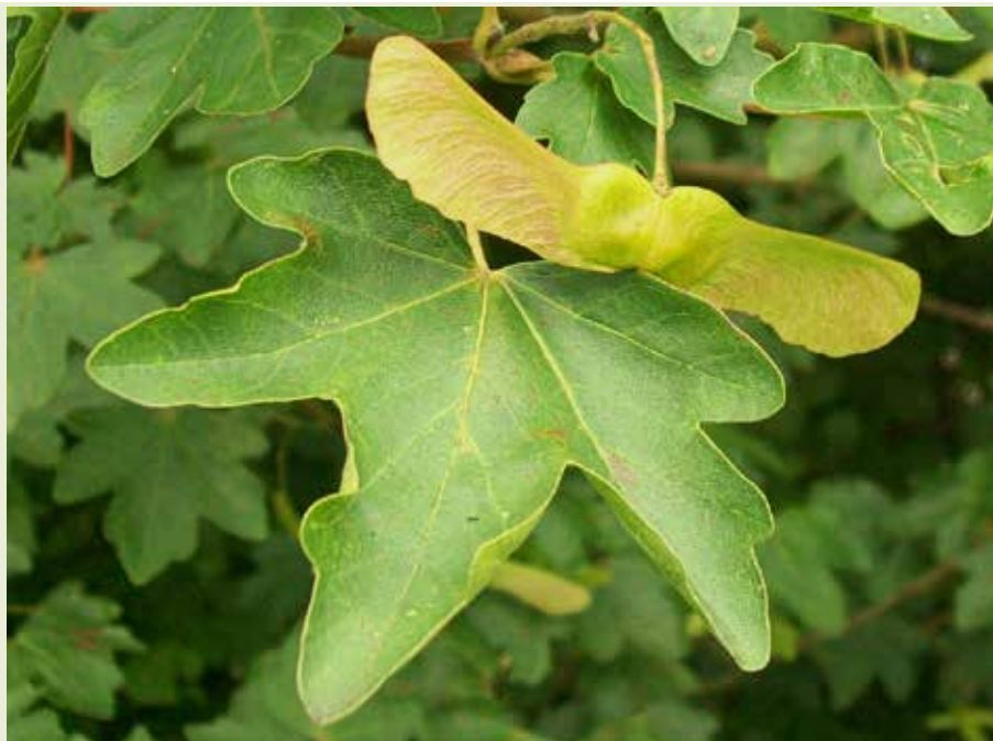
Acer campestre , blad en gevleugelde zaden © Peter O'Connor.

grotere of kleinere bomen, de veldesdoorn is meestal een kleine boom van zo'n 15 m hoog al zijn er ook veel grotere exemplaren. De beide andere soorten, de gewone en de Noorse groeien uit tot grote bomen van meer dan 20 m.