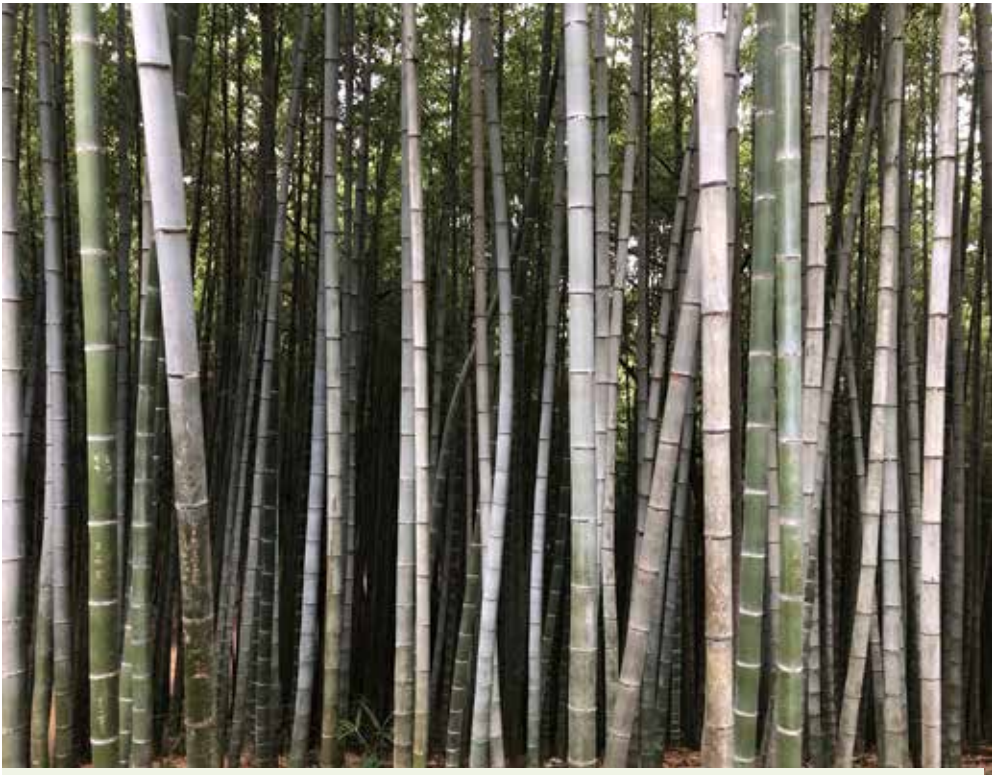
Bamboestelen van Phyllostachys nigra .

inheems te groeien in verschillende regio's, Australië, Noord-Amerika, Zuid-Amerika en Afrika. De laatste jaren wordt veel bamboe gekweekt in Europa. China is het leidende land in het kweken van bamboe, met India als 's werelds op een na grootste kweker van bamboesoorten. Sommige van de kleinste bamboeplanten bereiken uiteindelijk slechts een hoogte van 10 centimeter of minder, terwijl sommige van de grootste bamboeplanten zijn