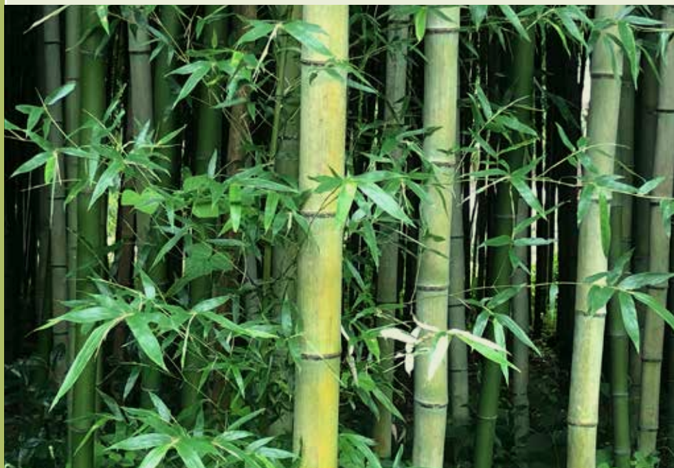
Foto boven: Jonge planten van P. bambusoides . Foto rechts: Een voorbeeld van het hoge bamboebos.

De reden voor zijn uitnodiging was dat ik hem mijn fascinatie voor bamboe vertelde. Overnachten in een