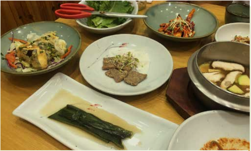
Een typisch Koreaanse maaltijd met linksonder gefermenteerde bamboebladeren.

hol en de basis is dik. Phyllostachys nigra is in eerste instantie bedekt wit poeder op de stengel; de plant wordt 10 meter of meer hoog en heeft een diameter van 5-8 cm. Het sap dat naar buiten sijpelt wordt gebruikt als medicijn. Phyllostachys bambusoides is de hoogste onder de Koreaanse bamboe: tot 20 meter hoog. De stelen zijn 12-15 cm dik en worden gebruikt om verschillende meubels en gereedschappen te maken.