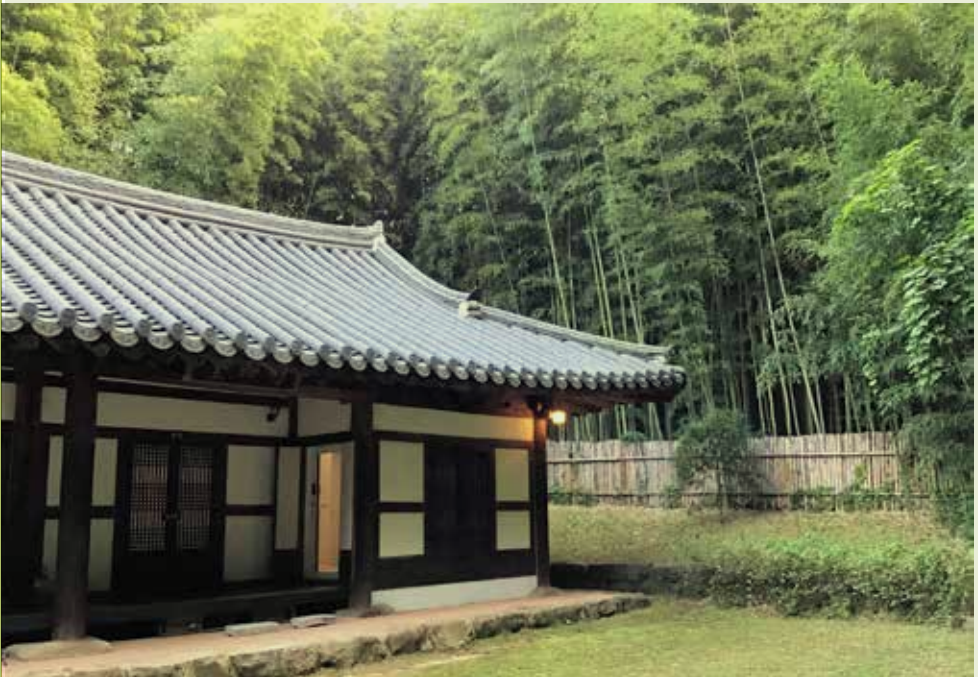
Een traditioneel Koreaans hotel met op de achtergrond het bamboebos.

Het bos bestaat voornamelijk uit drie soorten Phyllostachys pubescens , P nigra en P. bambusoides . Phyllostachys pubescens heeft stengels met bijna geen haren op het punt waar de bladeren en stengels samenkomen en is de dikste onder de bamboes met een hoogte van 10-20 m en een diameter van 20 cm. Het wordt in het Koreaans Maengjongjuk genoemd naar de god Maengjong, die als kind voor zijn ouders bamboescheuten verzamelde in de winter wanneer de sneeuw zich ophoopt. De stengels zijn