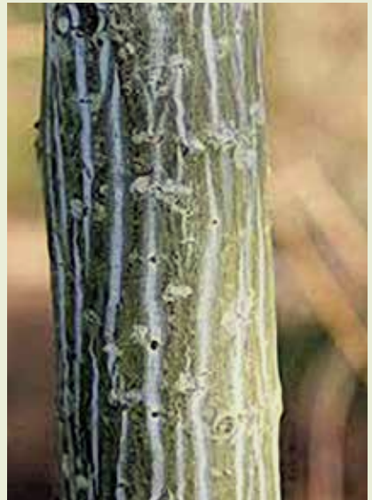
Links: Jonge bladeren van Acer davidii. Rechts: stam met gestreepte bast.