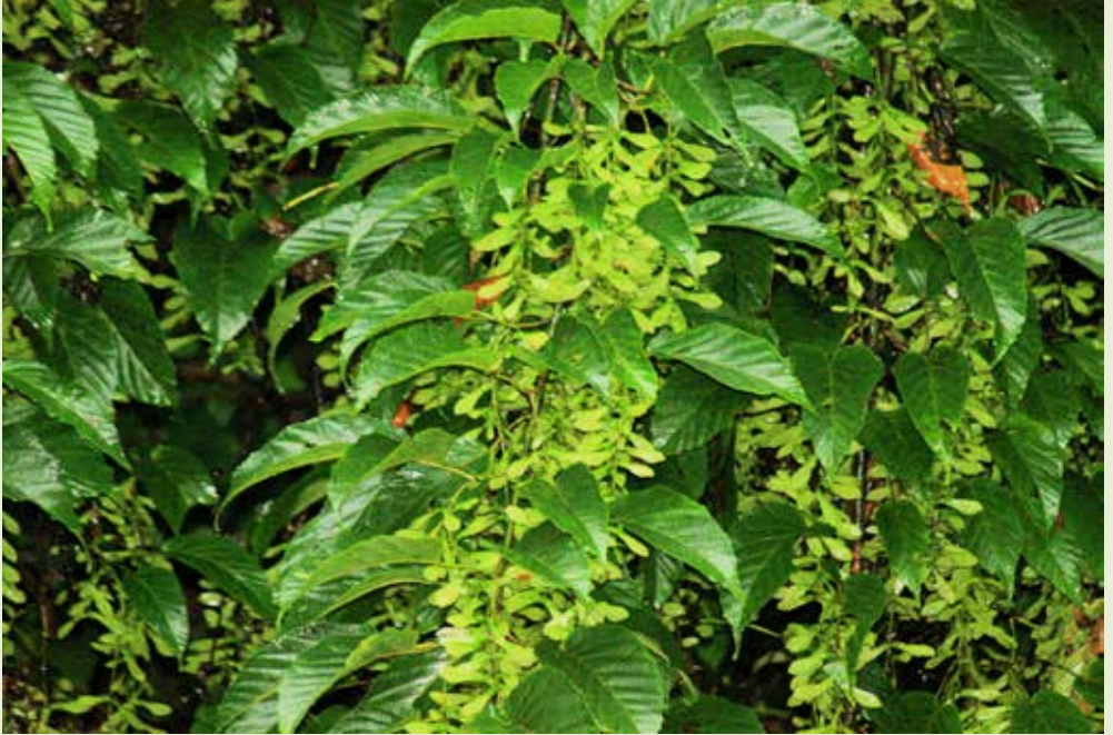
Acer davidii met gevleugelde zaden.