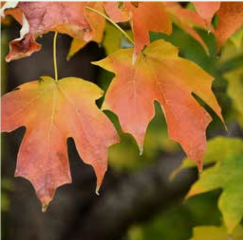
De bontgekleurde bladeren van Acer saccharum .

van de esdoorn staken daar een stukje riet in en hingen er een emmer van aardewerk of berkenbast onder. Om het sap te concentreren lieten zij het 's nachts bevriezen en schepten de volgende dag het ijs er af. Daarna werd het verder ingedampt. Van hen leerden de Europese kolonisten het procédé.