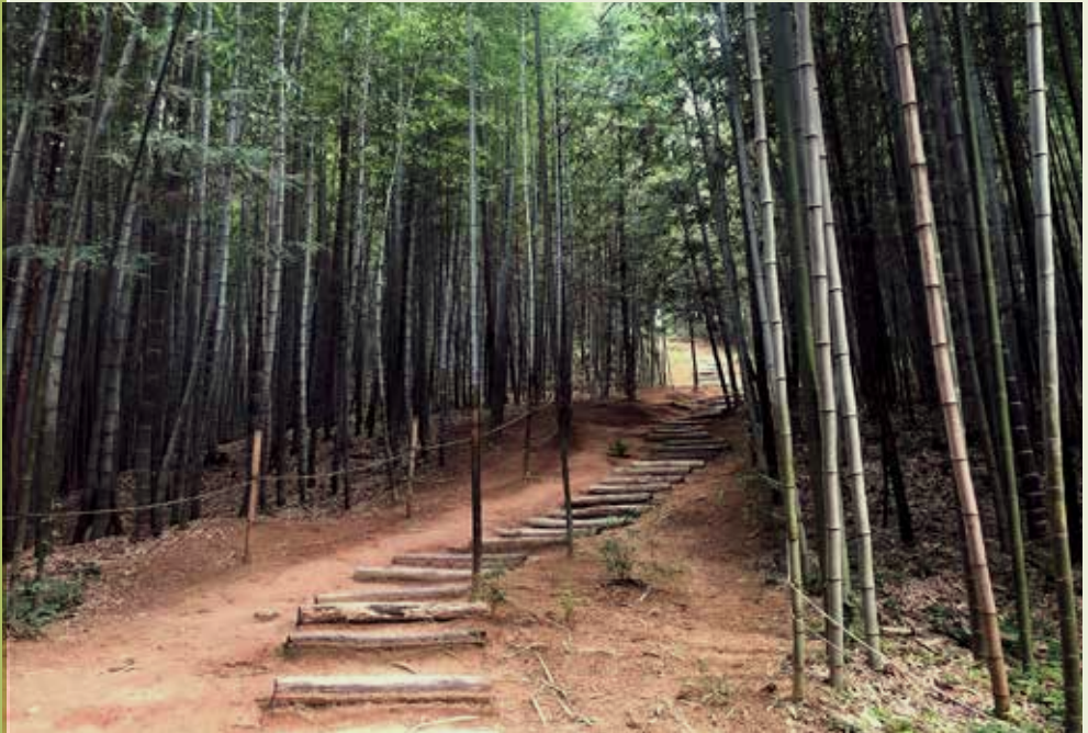
Het bamboebos is ongeveer 2 hectares groot met 2,2 km aan wandelpaden.

Bamboe is een zeer nuttige plant omdat de zaden van sommige soorten als graan worden gegeten en de jonge scheuten worden gekookt en gegeten als groenten. De rauwe bladeren kunnen worden gebruikt als voer voor dieren. Papier van goede kwaliteit wordt ook geproduceerd uit de verpulverde vezels van sommige soorten. De grootste stengels worden tot planken gemaakt om huizen en vlotten te bouwen; grote en kleine stengels worden aan elkaar gebonden om steigers op bouwplaatsen te