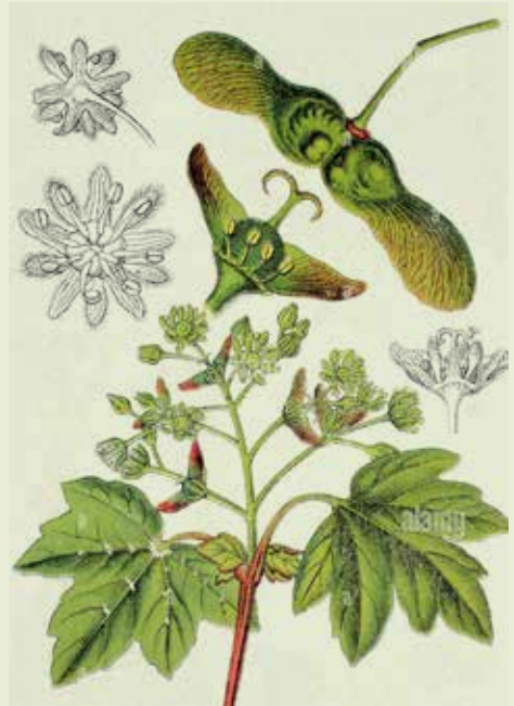
Acer campestre

De naam Acer dat scherp of spits betekent wijst mogelijk op de veelal handvormige bladeren met spitse punten van veel soorten. Het zijn