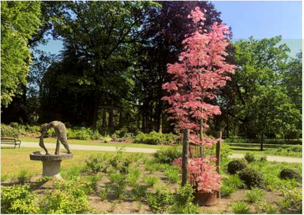
De nieuwe aanplant van de Chinese mahonie is een grote aanwinst van het park.